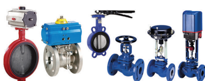
Manutenção em válvulas de controle