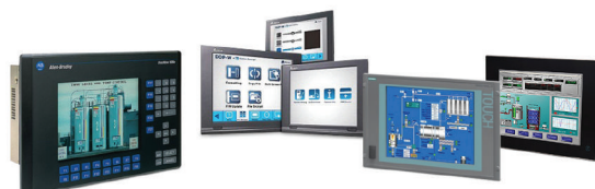
Manutenção em IHM