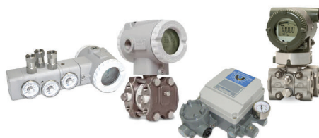
Manutenção em equipamentos de instrumentação e controle