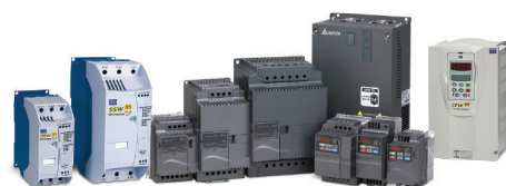
Manutenção em inversores de frequência e Soft Starters